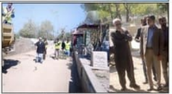
شہر قائد میں ایک عوامی اجتماع کے دوران لوگوں کی بڑھتی ہوئی شرکت دیکھی گئی ہے۔