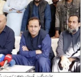
انٹرنیشنل جناح کے اشتراک میں ایک اہم اجلاس منعقد ہوئی ہے۔